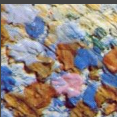
《大碗島的星期天下午》 創作細節