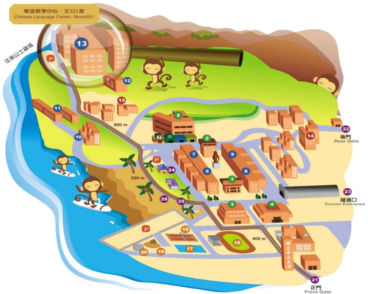
國立中山大學華語教學中心位置圖 Location of Chinese Language Center, NSYSU